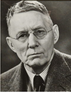
Johannes V. Jensen

Onsdag den 12. oktober kl. 19.00. Afgang fra Vesthimmerlands Museum kl. 18.30