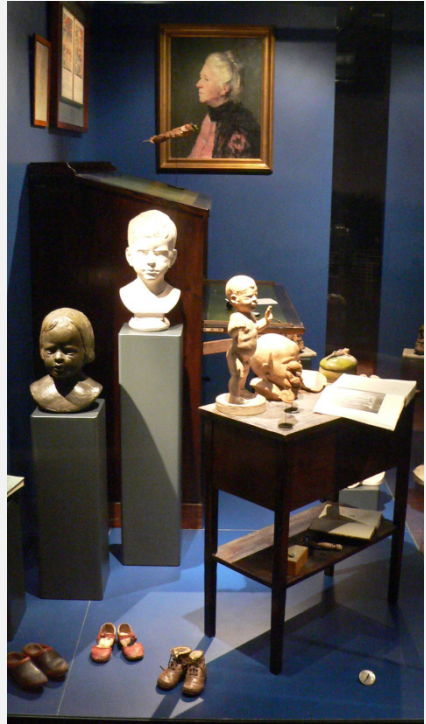
Johannes V. Jensen Museet. Udsnit af udstillingen i Rotunden.

Pris for medlemmer: 40,00 kr. For ikke-medlemmer: 50,00 kr