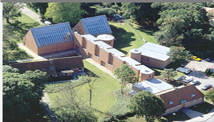
Vesthimmerlands Museum, Søndergade 44, 9600 Aars

Vesthimmerlands Museum er et statsanerkendt, kulturhistorisk museum med ansvar for arkæologi og nyere tids kulturhistorie i Vesthimmerland. Museet har base i Aars med administration, udstillinger og magasiner. Udstillingsbygningen er formgivet af Per Kirkeby, indviet i 1999 og fremstår som kunstværk og seværdighed for sig. Udover en fremragende arkæologisk samling rummer museet gode samlinger fra de sidste 300 år af historien, heriblandt en fin beholdning af landligt tekstil. Museets opgaver er ifølge museumsloven femfoldige: Indsamling, registrering, bevaring, forskning og formidling.