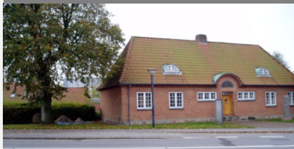
Lokalthistorisk Arkiv findes i kælderen til 1935 bygningen

Du er altid velkommen, hvad enten du vil studere lokalhistorie, stille spørgsmål eller aflevere materiale. Vi modtager gerne alle former for arkivalier, som skøder og andre papirer, der har tilhørt privatpersoner, firmaer eller foreninger – herunder regnskaber, protokoller og fotografier.