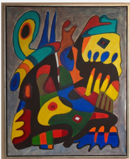
Uffe Berg: Solweigs Sang