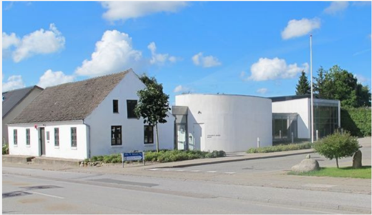
Johannes V. Jensen Museet, Farso