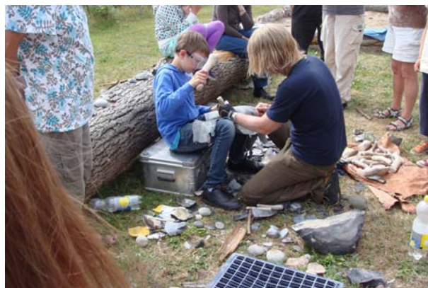
Stor interesse for flintarbejdet

Derfor har der været afholdt møde med Museumsforeningen for Vesthimmerlands Museum, dels for at vi lærer hinanden at kende og dels for at udveksle synspunkter omkring en støttefoenings