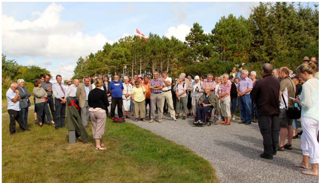
Afsløring af ny skiltning i Ertebølle