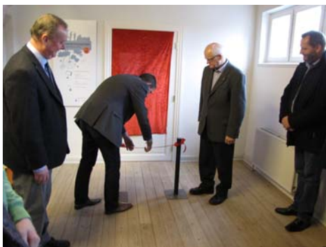
Åbning af Kulturarvstjenesten

Efter en forrygende opstart af Vesthimmerlands Museums nye Kulturarvstjeneste i 2013 har medarbejderne nu taget hul på en lang række nye og spændende tiltag: Informationsprojekter i landskabet, kirkeomvisninger, byvandring og lokalhistoriske aftener er blot nogle af de aktiviteter, som Kulturarvstjenesten Vesthimmerland har i støbeskeen.