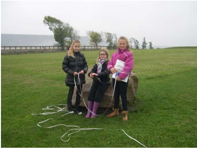
Matematik på Aggersborg