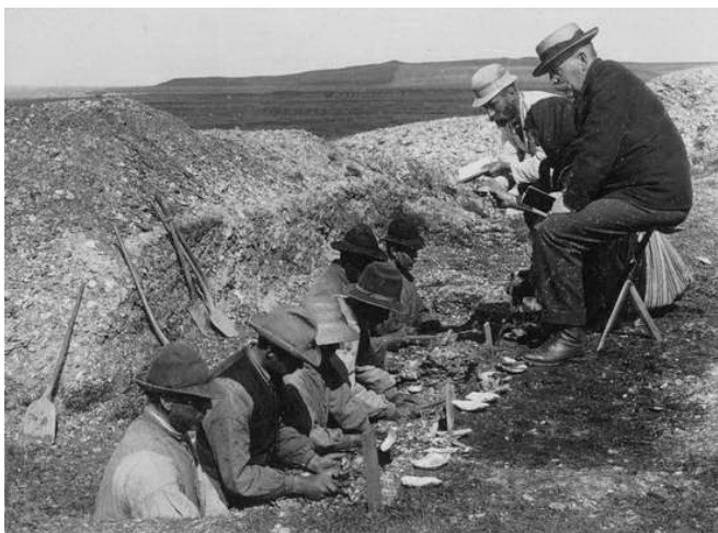
Udgravning af køkkenmøddingen ved Ertebølle i 1890'erne. Det var primært arbejdsmænd, der gravede i køkkenmøddingen, mens forskerne instruerede og noterede.

sagen, og i årene 1893 til 1898 blev der foretaget omfattende arkæologiske og naturvidenskabelige undersøgelser af en række køkkenmøddinger, deriblandt Ertebøllekøkkenmøddingen.