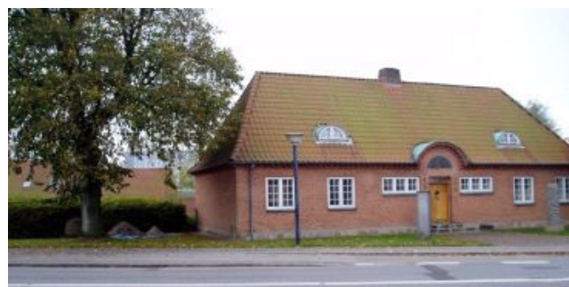
Lokalhistorisk Arkiv, Aars

Lokalhistorisk Arkiv Aars har til huse i kælderen under den "gamle" museumsbygning. Her findes et stort materiale af dokumenter og billeder om enkeltpersoner, lokaliteter, bygninger, foreninger og begivenheder, samt en stor samling af avisudklip vedrørende lokalhistoriske emner. Du er altid velkommen, hvadenten du vil studere lokalhistorie, stille spørgsmål eller aflevere materiale. Vi modtager gerne alle former for arkivalier, som f.eks. skøder, eller andre papirer, der har tilhørt privatpersoner, firmaer og foreninger, herunder regnskaber, protokoller eller fotografier. De behøver ikke at være gamle. Det bliver de, hvis arkivet får lov til at gemme dem. Giverne bestemmer, hvilke klausuler, der lægges på materialet.